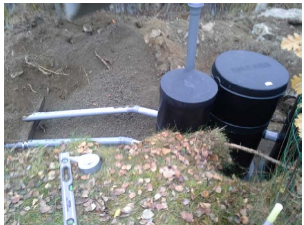
Kuva 4. Kalkkisuodattimesta ja näytteenottokaivosta lähtee 2 putkea purkupaikkaan. Kalkkisuodattimen poistoviemäriputkeen on liitetty tuuletusputki.