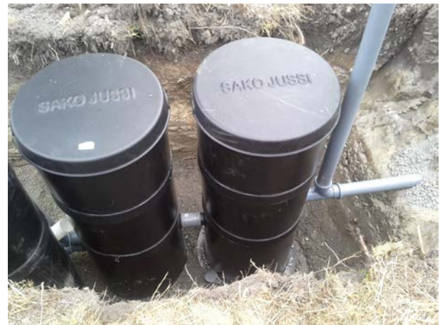
Kuva 3. Biojussi-sakosuodatinkaivo ja Kalkkisuodatinkaivo liitetty yhteen liukumuhvilla. Tuuletusputki on liitetty tuloviemäriin.