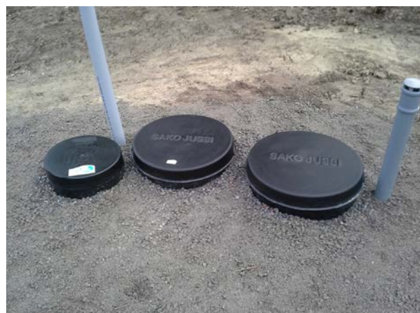
Kuva 6. Kaivonkannet ovat maan tasalla ja tuuletusputket ylettävät lumirajan yläpuolelle. Kuvassa näkyy Biojussi-Mökki 1050 -puhdistamo.