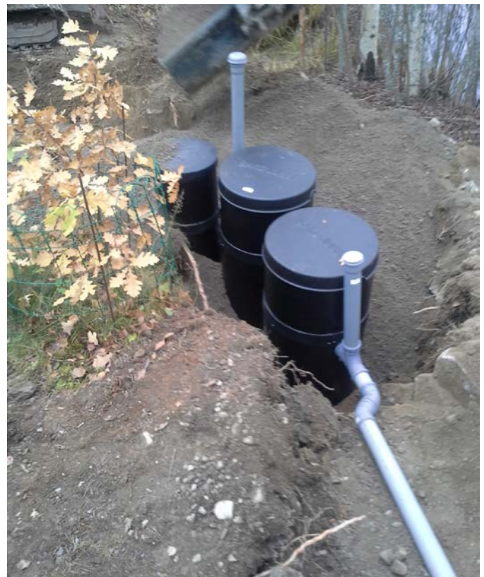
Kuva 3. Kuvassa näkyy Biojussi Mökki 1050 -puhdistamo. Biojussi Sauna 650 -puhdistamossa riittää yksi tuuletusputki kaivon perässä.