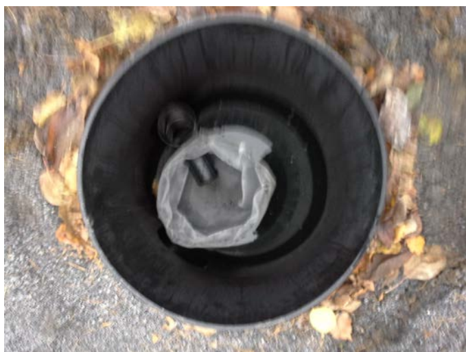
Kuva 5. Vesi virtaa Biojussi-sakosuodatinkaivon suodatinpussin läpi, jolloin suodatinpussiin jää pesuvesien kiintoainetta. Suodatinpussi tulee tyhjentää ja pestä ennen talvea.