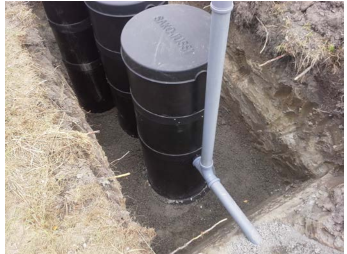
Kuva 2. Kaivannon tulee olla sellainen, että maan saa tiivistettyä kaivon ympäriltä.

Biojussi Sauna 650 voidaan asentaa myös maanpäälle. Tällöin tyhjennystä varten kaivon alareunaan porataan reikä poistotulpalle.