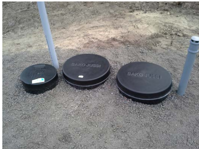
Kuva 4. Kaivonkannet ovat maan tasalla ja tuuletusputket ylettävät lumirajan yläpuolelle. Kuvassa näkyy Biojussi Mökki 1050 -puhdistamo.